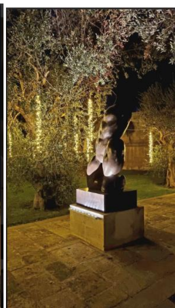
La Fiermontina Luxury Home 11 of 15

S e Lecce è una delle città d'arte più belle d'Italia che incanta visitatori e turisti e li accoglie con generosa ospitalità, esistono in città delle dimensioni dal fascino più "sussurrato" che rendono la sua scoperta - se possibile - ancor più suggestiva e regalano atmosfere magiche a chi sa scoprirle. Una di queste dimensioni, ricca di tesori d'arte e memorie romantiche, ma anche di un'offerta di esperienze di soggiorno assolutamente contemporanee, reca la firma Fiermontina Family Collection , prestigiosa insegna di ospitalità ed eventi culturali dalle profonde radici pugliesi ma dallo spirito (e dal vissuto) cosmopolita. Tra cronache mondane e romanzo, storie di avanguardie artistiche e di brucianti passioni, le vicende dorate e avventurose della famiglia Fiermonte risuonano tra gli splendidi ambienti di due storiche dimore leccesi - la Fiermontina Luxury Home una masseria moderna immersa in un uliveto con piscina e