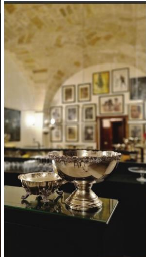
La Fiermontina Palazzo Bozzi Corso 7 of 16