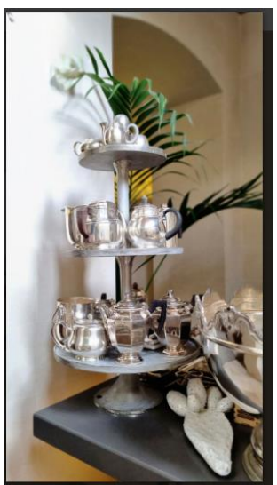
La Fiermontina Luxury Home 22 of 28