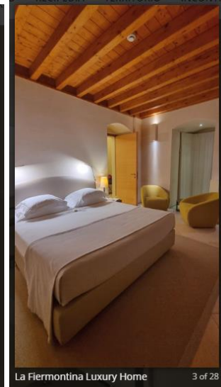
La Fiermontina Luxury Home 3 of 28