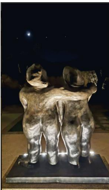
La Fiermontina Luxury Home 10 of 15