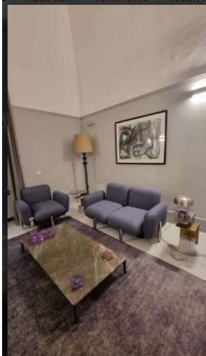
La Fiermontina Palazzo Bozzi Corso 6 of 16