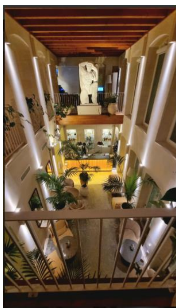
La Fiermontina Luxury Home 7 of 15