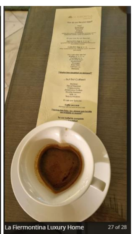
La Fiermontina Luxury Home 27 of 28