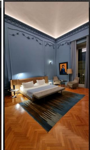
La Fiermontina Palazzo Bozzi Corso 8 of 16