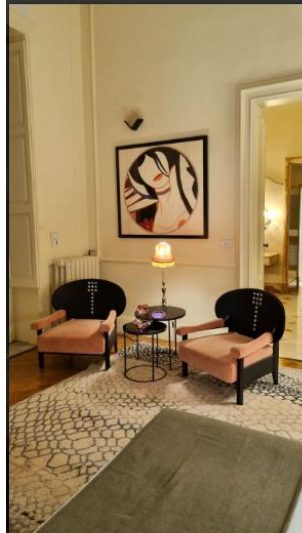
La Fiermontina Palazzo Bozzi Corso 11 of 16