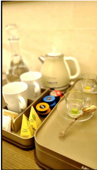
La Fiermontina Luxury Home 19 of 28