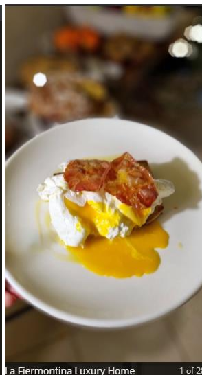
La Fiermontina Luxury Home 1 of 28