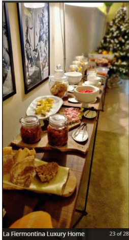
La Fiermontina Luxury Home 23 of 28