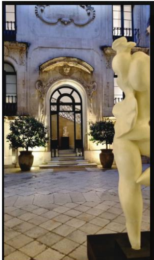
La Fiermontina Palazzo Bozzi Corso 5 of 16