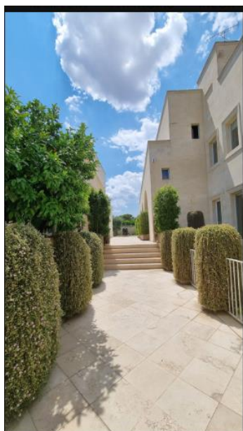
La Fiermontina Luxury Home 6 of 15