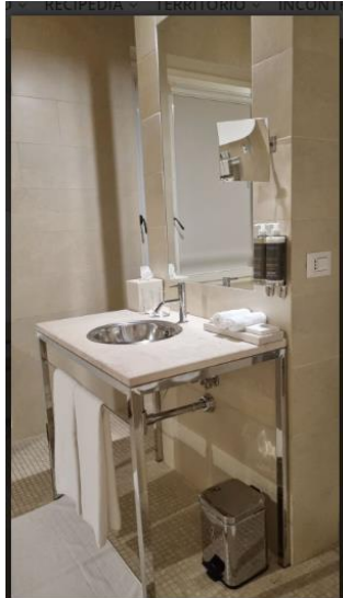
La Fiermontina Luxury Home 20 of 28