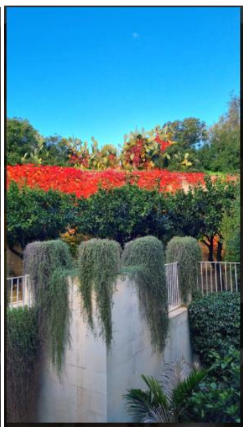
La Fiermontina Luxury Home 8 of 15