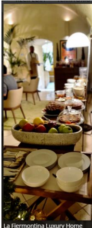
La Fiermontina Luxury Home 24 of 28