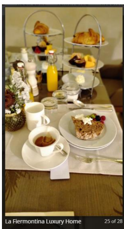
La Fiermontina Luxury Home 25 of 28