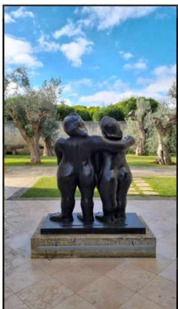
La Fiermontina Luxury Home 9 of 15