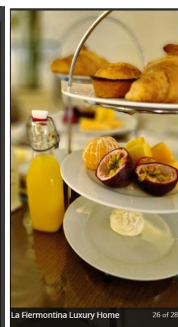
La Fiermontina Luxury Home 26 of 28