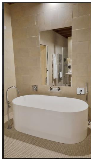
La Fiermontina Luxury Home 21 of 28