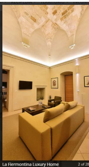
La Fiermontina Luxury Home 2 of 28