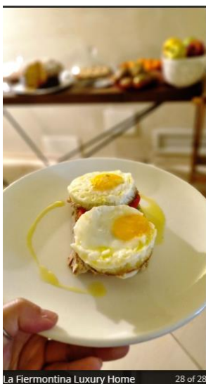
La Fiermontina Luxury Home 28 of 28