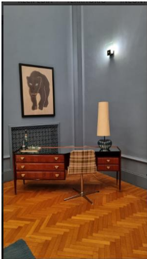
La Fiermontina Palazzo Bozzi Corso 9 of 16