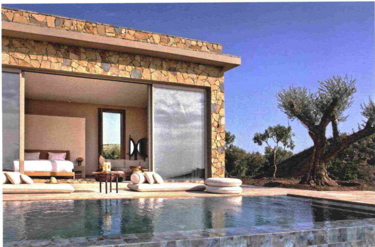
La piscina esterna di una suite de La Fiermontina Ocean, a Larache