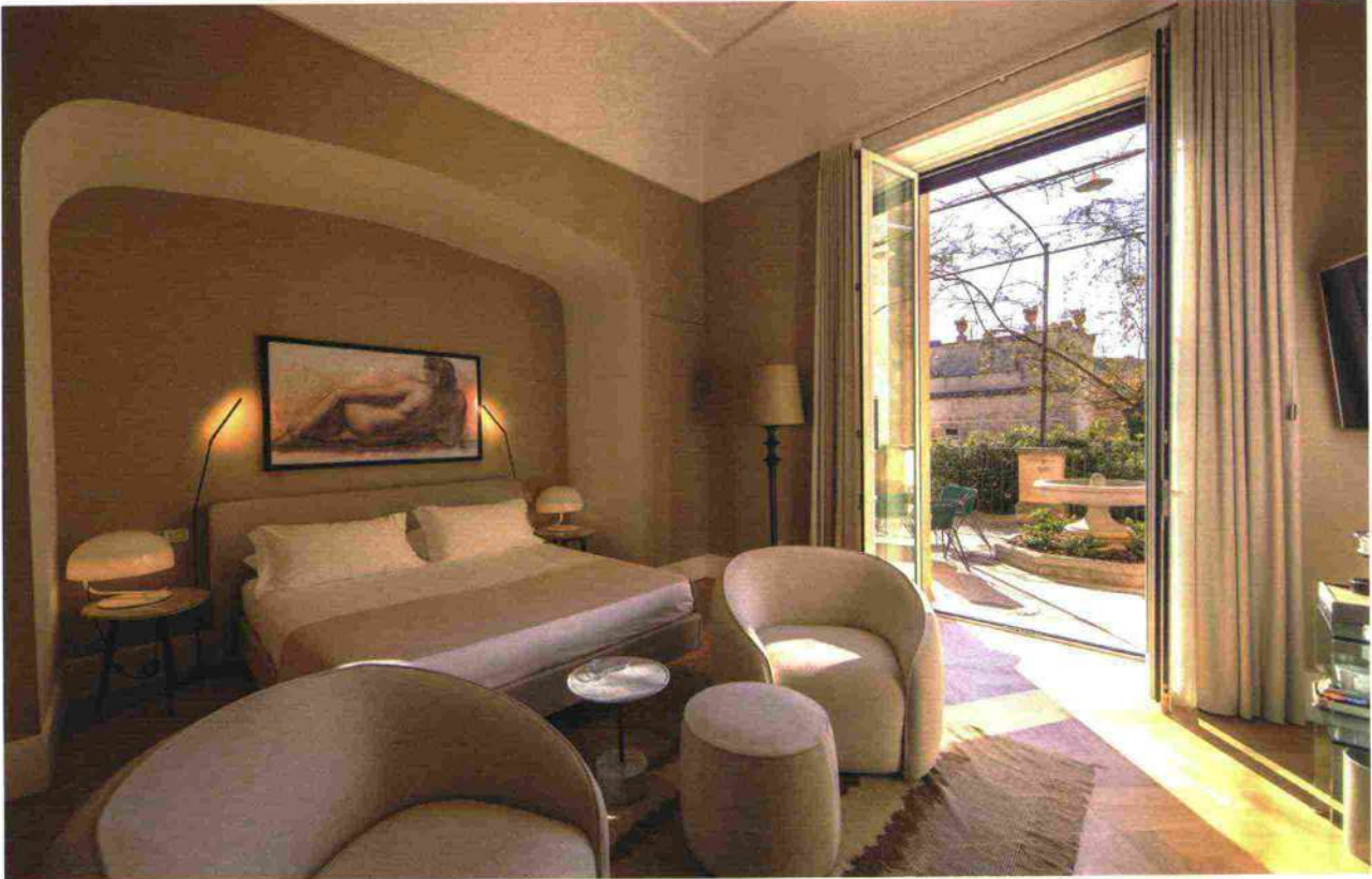
La Junior Suite Cappuccino con terrazza de La Fiermontina Palazzo Bozzi Corso